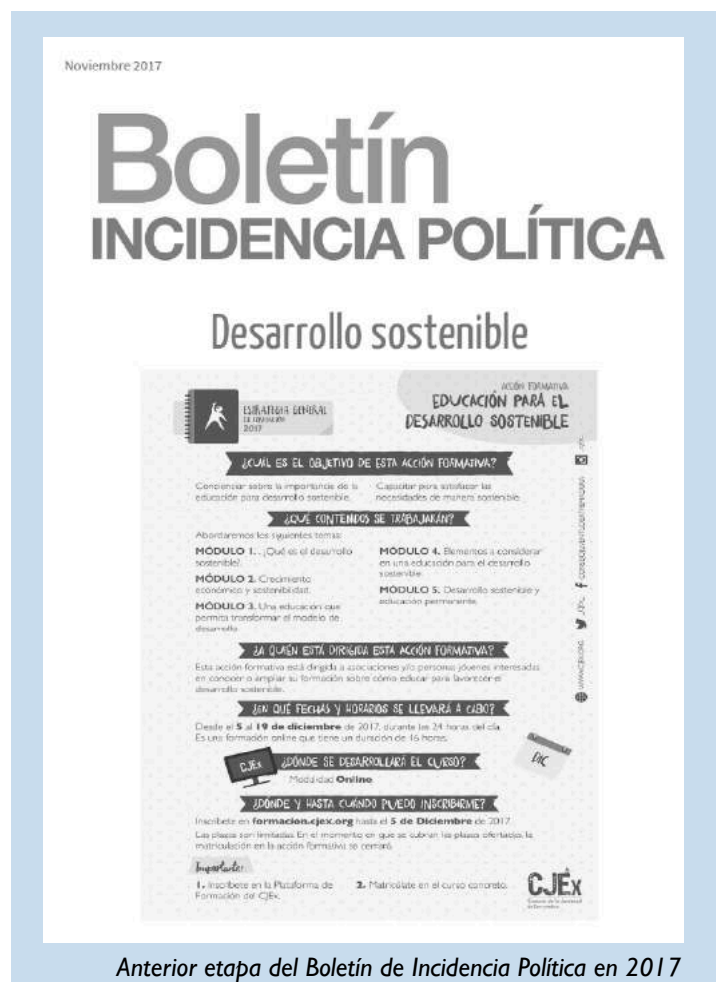
Anterior etapa del Boletín de Incidencia Política en 2017

Por ello mismo, impulsamos este Boletín de Incidencia Política, que contiene a la vez, los planteamientos de la juventud, el análisis de realidades detectadas sobre las que actuar, así como ejemplos y propuestas de política pública. Todo ello, como altavoz del trabajo y los avances de la juventud extremeña, promocionando el esfuerzo y los progresos en juventud desde el CJEx e informando a las instituciones públicas de las necesidades y demandas identificadas. Enriqueciendo el desarrollo político y social de nuestra región, llevando a cabo proyectos y propuestas estructuradas, conseguiremos el impulso necesario para que Extremadura alcance sus metas de manera efectiva.